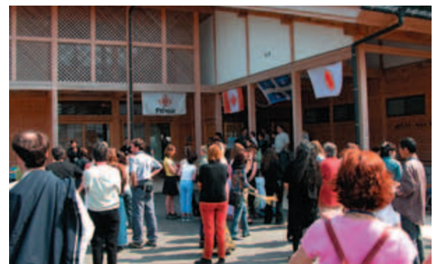
Ouverture de l'Exposition : Le drapeau de Prévost faisait partie du décor.