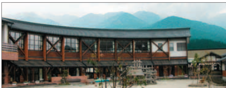
L'école aussi a été construite grâce à la contribution de Monsieur Nakashima.