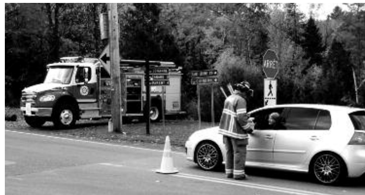
Les citoyens ont été généreux lors de la collecte de fonds organisée par les pompiers de Sainte-Anne-des-Lacs.