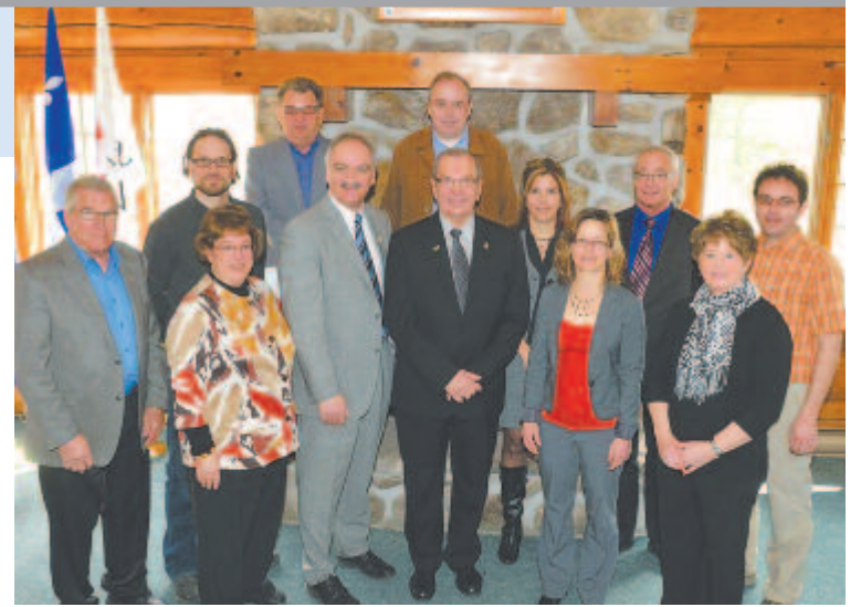
Les nombreux partenaires présents lors de l'annonce pour le développement culturel à Saint-Jérôme.

Grâce à un investissement de 80 000 $ de la Ville de Saint-Jérôme, de 20 000 $ de la régie inter-municipale et de 100 000 $ du MCCCF, la capitale régionale des Laurentides pourra compter sur un total de 200 000 $ afin de réaliser sept projets en développement culturel.