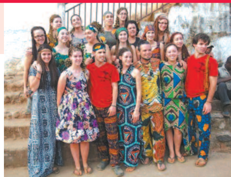
Le groupe d'étudiants du Cégep au Cameroun

Un choc culturel certain, eux qui ont vécu avec des familles camerounaises durant tout le séjour. Mis à part leur travail à la pépinière, les