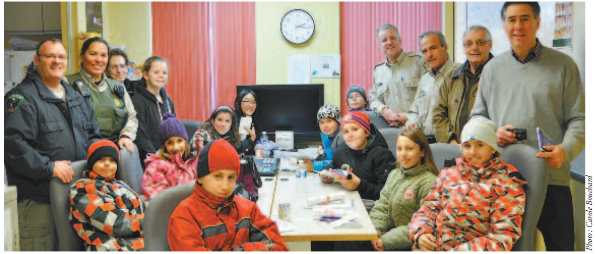
Le groupe des élèves de 6 e année était accompagné des représentants des clubs Optimiste de Saint-Hippolyte, Sainte-Sophie et Prévost.