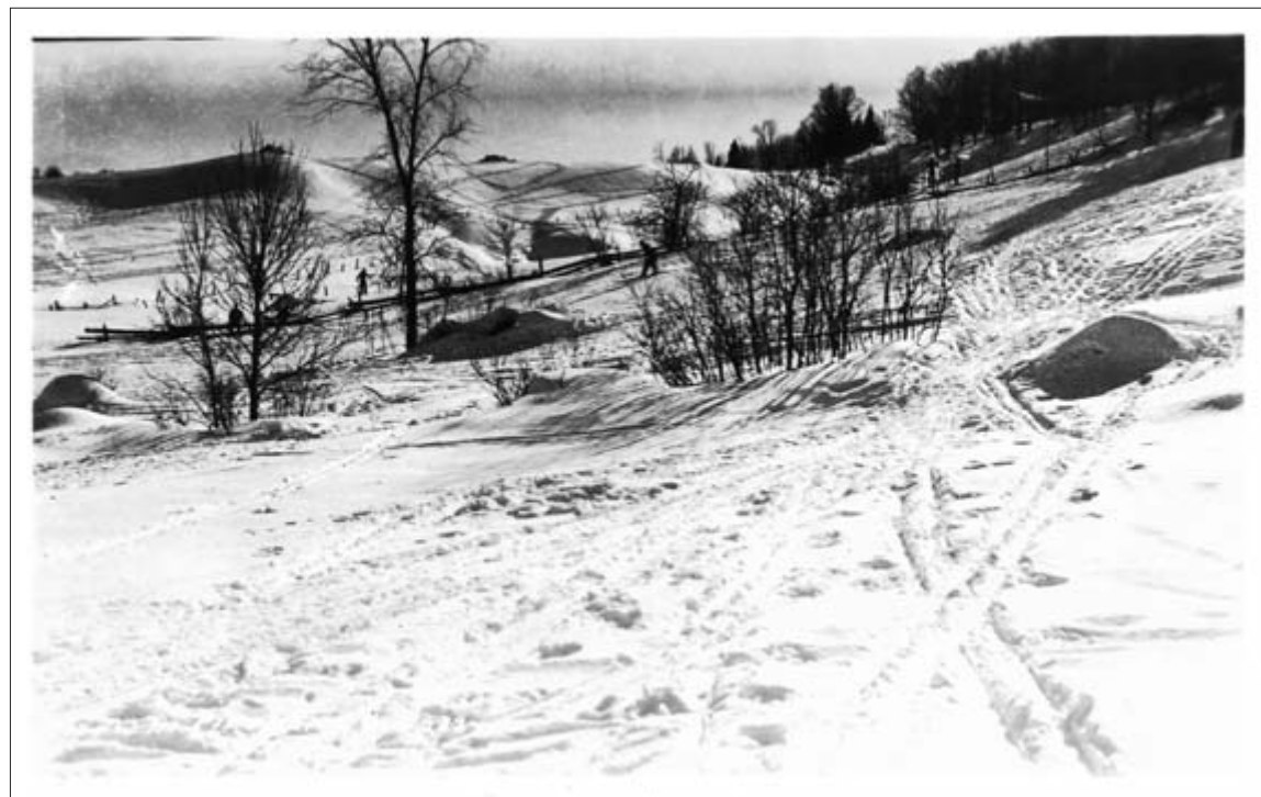
BENOÎT GUÉRIN – Des sentiers de ski de fond à Piedmont vers 1940. Carte postale: Photo L. Charpentier, collection privée de l'auteur.