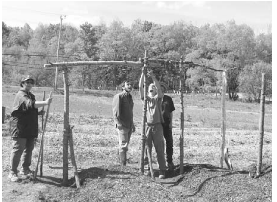
Début de l'installation des structures

nues. Les arbres, les clôtures, les murs et même le maïs peuvent servir de tuteurs. On pourra installer des treillis à certains endroits pour donner un support à certaines plantes. La construction de « condos à patates » dans des « cages à poules » peut aussi donner lieu à une production de différentes plantes en hauteur. Cette façon de cultiver à la verticale procure non seu-